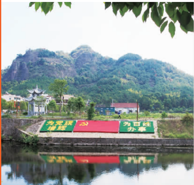
上杨村山清水秀风景秀丽

垃圾分类是一项繁杂琐碎的工作,上杨村这些可爱可敬的妇女义工团成员,正用真诚、耐心和爱心,认认真真、不畏艰辛地做好这一项看上去简单,却着实不易的工作。