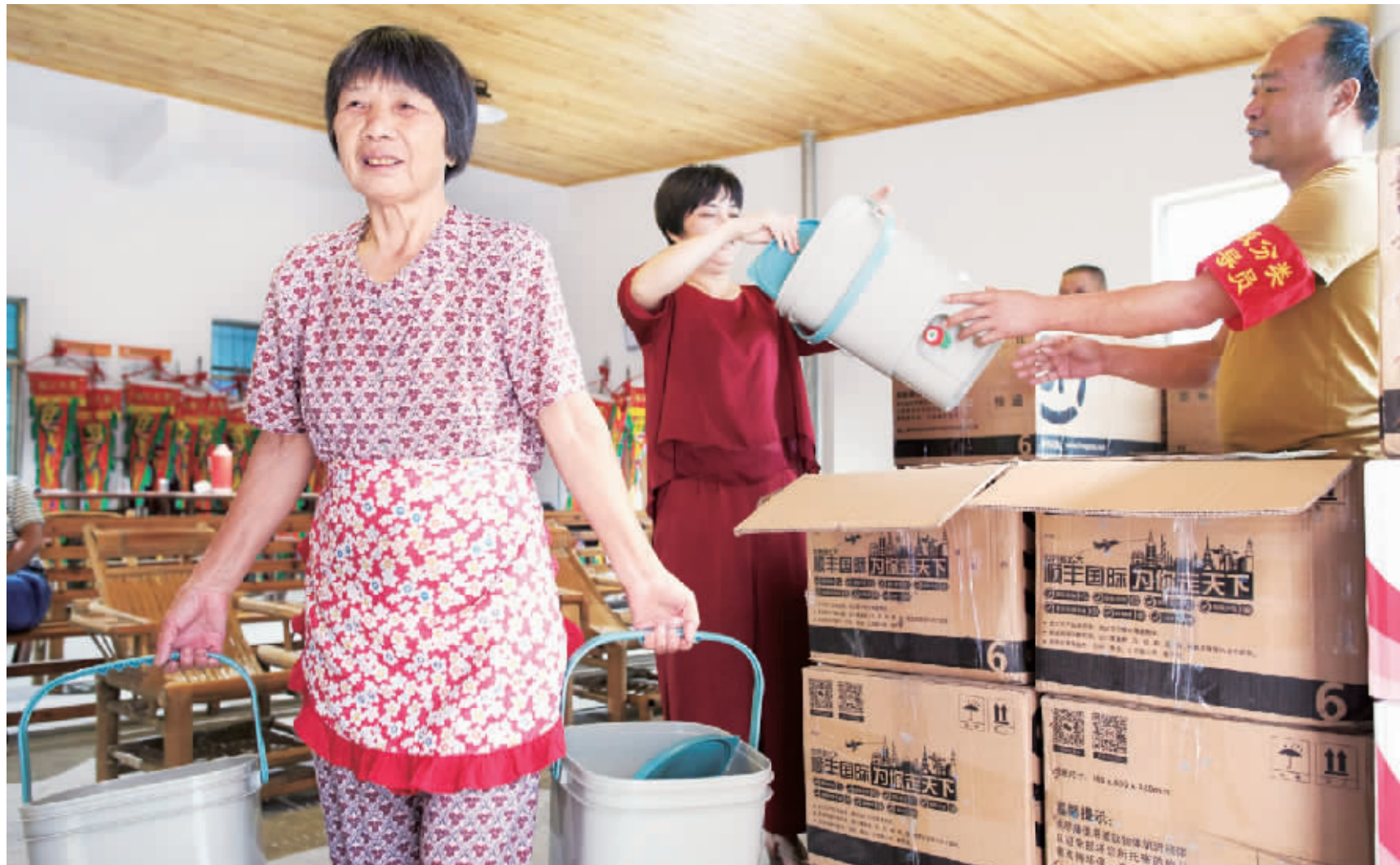
毛山村村民领到从台湾运来的生物堆肥桶