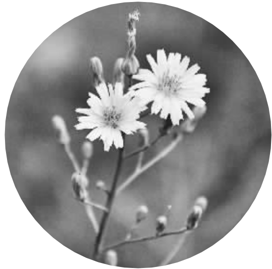
上图:苣荬菜;右图:苦苣菜

现在的人们说到苦,说的和想的都是一种味道,但古人造这个字,原本说的是一棵草。古代的象形字简化到今天,已很难看出这棵草的模样,但那棵草还在这个字的上面。 我们远古的先人似乎生活在草从里,采草是日常生活,《诗经》第一首就有一个女子在水里采苜蓿菜——说是菜,不过是能吃的草。当然,采草也不仅是为了吃,毕竟,古时社会还没有流行只顾舌尖不管心灵的吃货。那时候,草的功用和人的精神渴求一样多:采蓝可染色,采车前草的女人是为了怀孕生子,采蒿草用来祭祀,采葛藤可织布,采艾草是做药……染色、怀孕和祭祀,是日常,也都是神圣的事。古人的日常就是这样的,现在看来很普通的事,那时候都被染上了神圣的色彩。长在田野、采在手里的那些野草野菜,也跟着有了点神圣的味道。