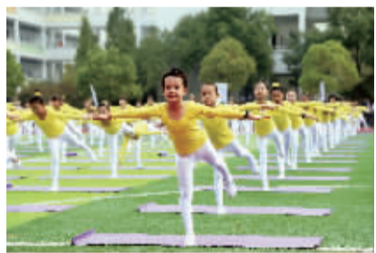
宾虹小学全员素质操展示