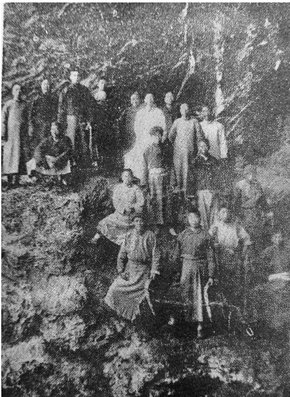
疏浚双龙洞开工典礼

1931年春，黄维时辞官返回金华老家，以律师为业。他在从事律师业务之余，发起整理金华山、开辟双龙洞诸胜迹的工作，为