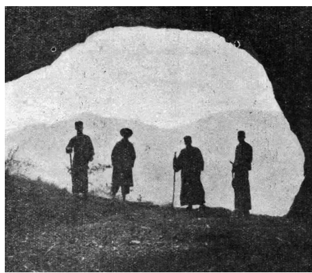
《北山朝真洞口》