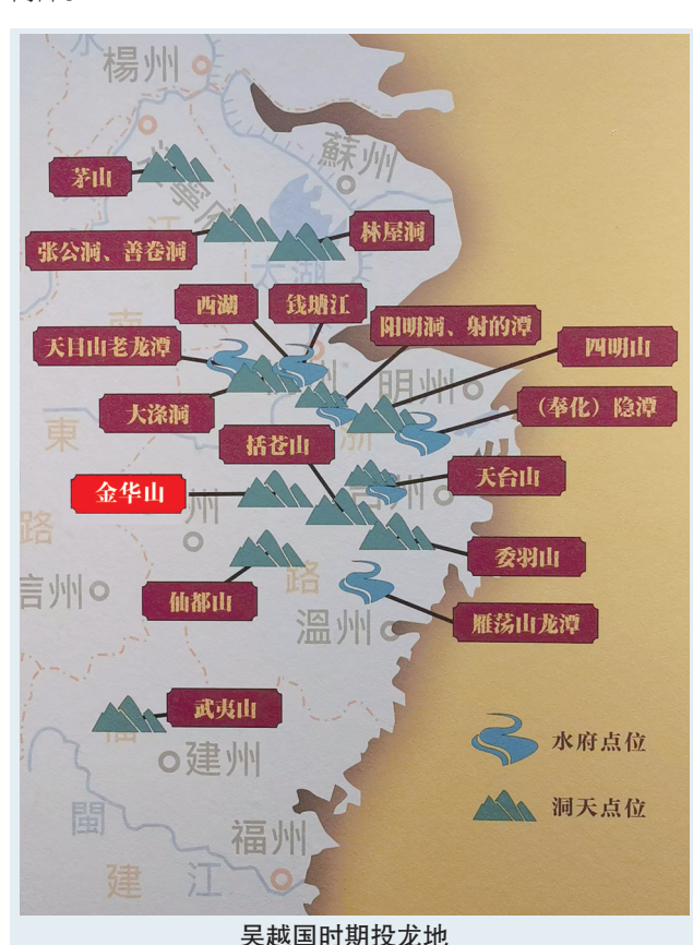
吴越国时期投龙地

“未及丈，则至内洞矣。豁然高敞，广大颇类外洞。上下四旁，飞崖流乳，皆如涌涛积雪。罗列怪状，伫玩间若身在琼楼玉阙中。” “行五六丈渐高，复入一门。其上穹然如华盖，名为钟楼，中悬石钟甚逼。像下有石狮子踞而坐。过丈许，乃为一龙潭，水尤清泚。宋□□中，贵人投龙于此，岁早祷辄应。由潭而上，道狭不可穷。土人曰：盖通四明、天台、洞庭诸山。”