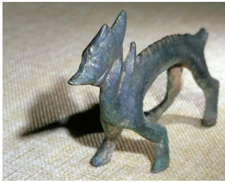
1987年双龙洞出土的“小青龙”

投龙，是一种古老的道教祈福仪式，它发端于秦汉时期和自然崇拜有关的山川祭祀，兴盛于唐宋，几乎每处名山大川都有。金华山，也不例外。