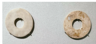
1987年双龙洞出土的玉璧